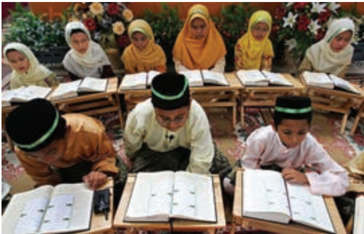
آموزش قرآن در کشورهای اسلامی