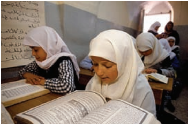
آموزش قرآن در کشورهای اسلامی

آیا مبنا یا اصل دیگری را دربارهٔ ارزشیابی و آزمون برگرفته از آموزه‌های قرآن یا سنت معصومین علیهم‌السلام را می‌شناسید؟ توضیح دهید.